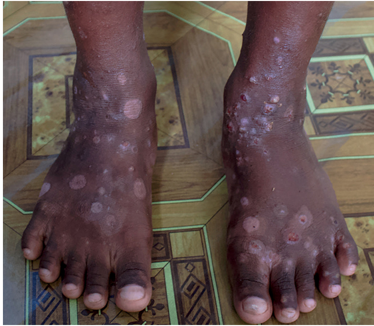
Fig. 1. Lesiones de escabiosis con impétigo secundario. Imagen procedente de Engelman et al. 3