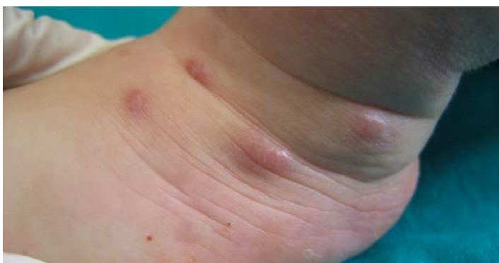
Fig. 5. Nódulos postescabióticos.